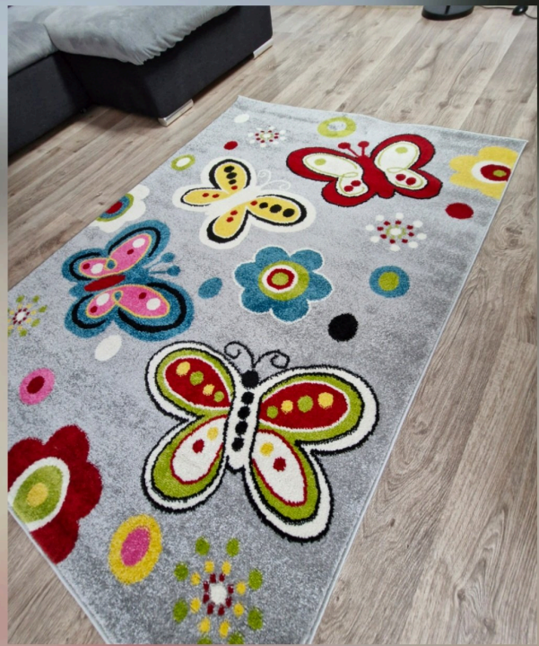
Motyle 581 L.Grey